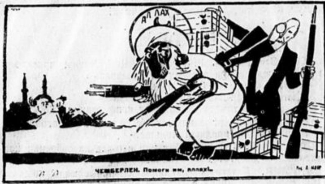
ЧЕМБЕРЛЕН. Помоги им, аллах!