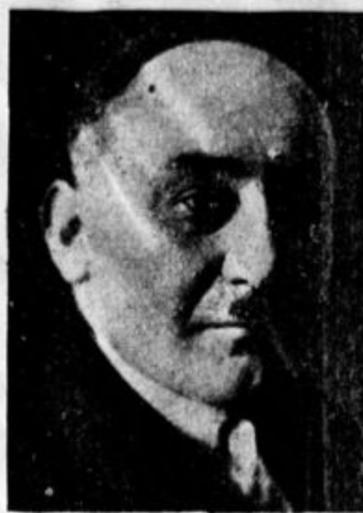
Тов. Копп, назначенный послом СССР в Японию и выезжающий туда в апреле.

Московский комсомол принял шефство на комсомольца Киргизской Республики.