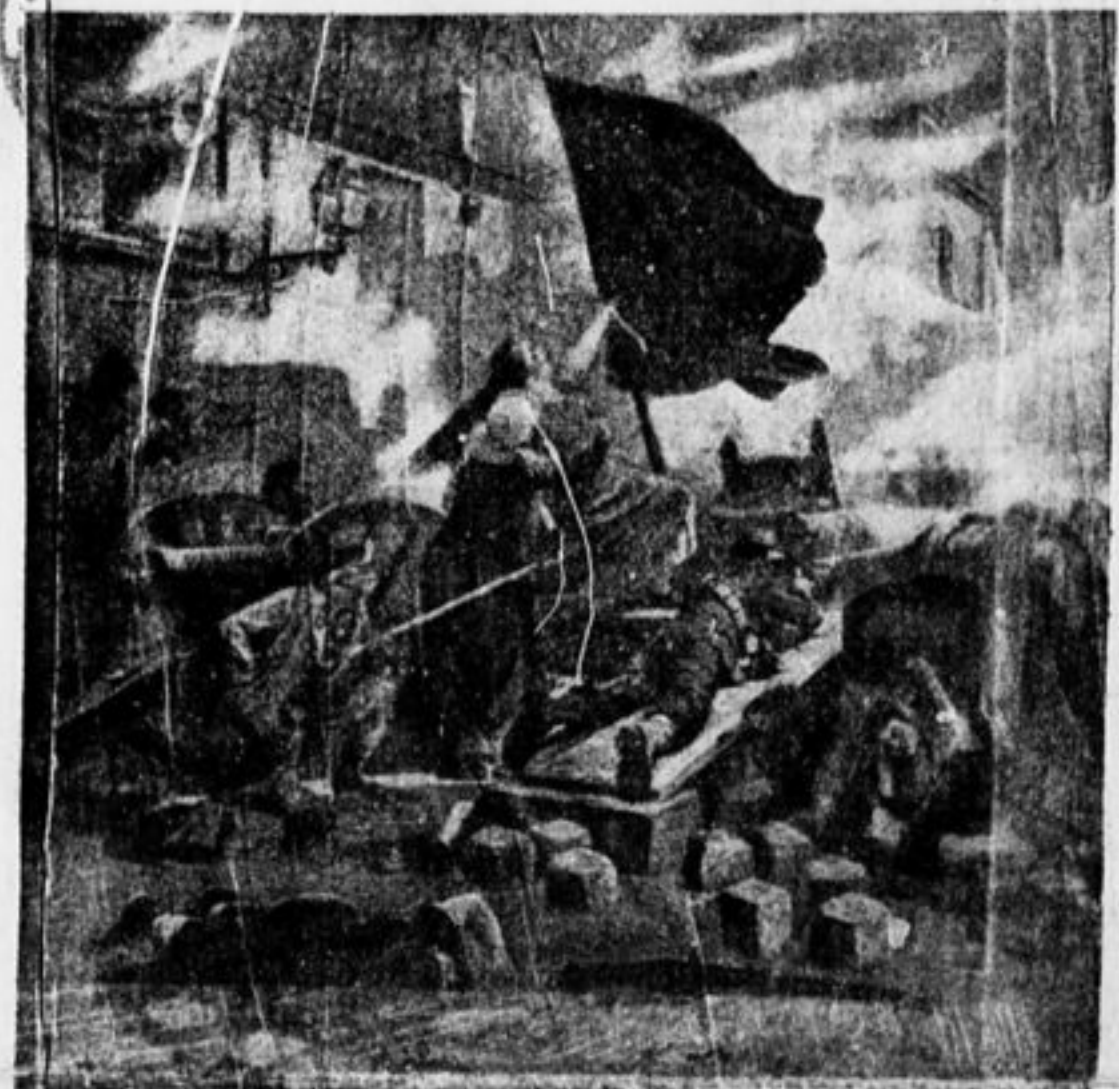
На баррикадах Парижской Коммуны.