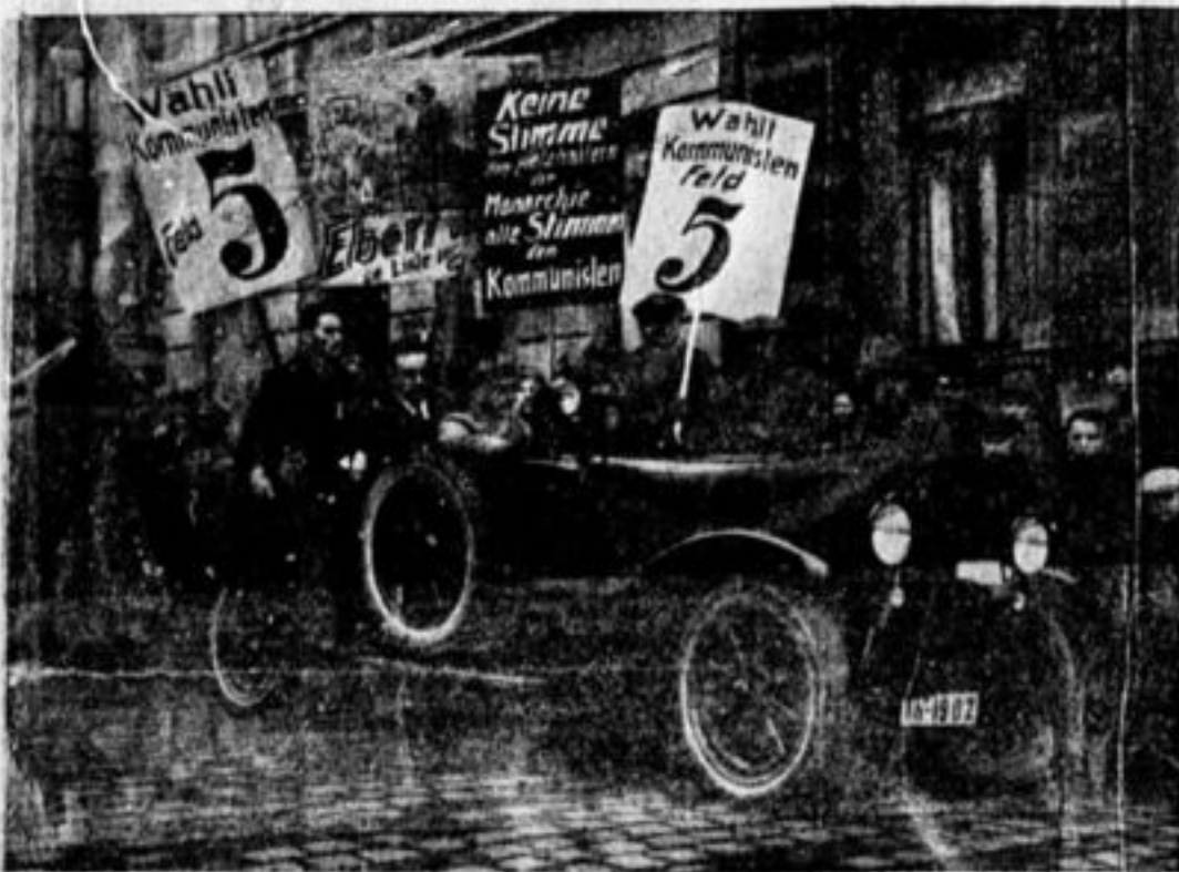
Автомобиль немецкой компартии на улицах Берлина, призывающий голодовать за коммунистов.

Необходимо, чтобы в Советах были рабочие от станка кре-