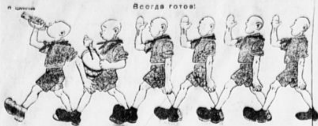
Пионер всегда готов к барабанному бою.